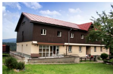
- zde budeme bydlet, tvořit a relaxovat