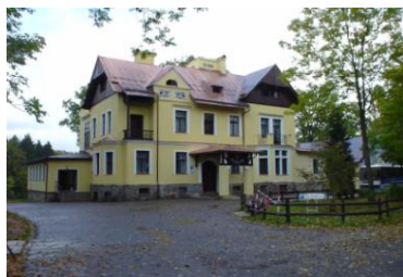
- v této budově se budeme stravovat