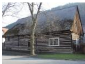
- Zbečno-Hamousův statek