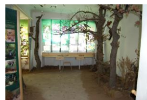
- Info-centrum Křivoklát Lesy ČR