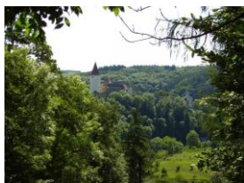
- Křivoklát a okolí